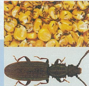
Testereli Böcek ( Oryzaephilus surinamensis )