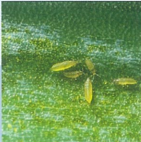
Thripsler ( Thrips spp. )

RUTGERS 22E kuvvetli alkali karakterdekiler hariç, bilinen birçok insektisit, fungusit ve akarisitlerle karıştırılarak kullanılabilir. RUTGERS 22E ile yapılacak karışımları uygulamadan önce çiftçinin kendi imkan ve sorumluluğunda bir ön karışım testi ve küçük bir alanda deneme yapması önerilir.