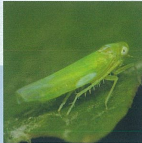
Yaprak Pireleri ( Empoasca spp. )